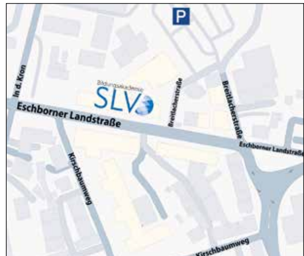
Standort Frankfurt am Main